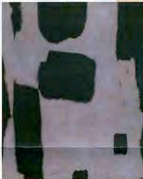
Black and Gray. L'artiste met ici en valeur des formes qui semblent flotter dans l'espace.

résultats ne dépassant guère les quelques milliers de dollars. En galeries (Charles Pollock est représenté à New York par Jason McCoy, et en Europe par l'American Contemporary Art Gallery à Munich), les prix sont nettement plus élevés et peuvent atteindre 100 000 dollars. L'œuvre de cet artiste méconnu